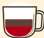
Dirty Chai Latte Chai latte + espresso 5.00€